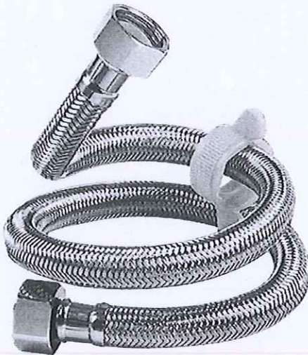
Đường ống cấp nước mới, đảm bảo an toàn The new water pipes, safety ensured

Để đảm bảo chất lượng và an toàn trong căn hộ, BQLTN khuyến cáo Quý Cư dân kiểm tra/thay mới đường ống cấp nước sinh hoạt trong căn hộ định kỳ mỗi 6 tháng/lần nhằm tránh các sự cố bể ống nước, tràn nước gây thiệt hại cho tài sản bên trong căn hộ và khu vực công cộng./ To ensure the quality and the safety in the apartment, The MO recommended to check/replace the old water supply pipes in the apartment once every 6 month to avoid the water pipe break/leak, which cause the water damages in the apartment and the common area.